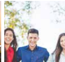
Menschen ganz lassen